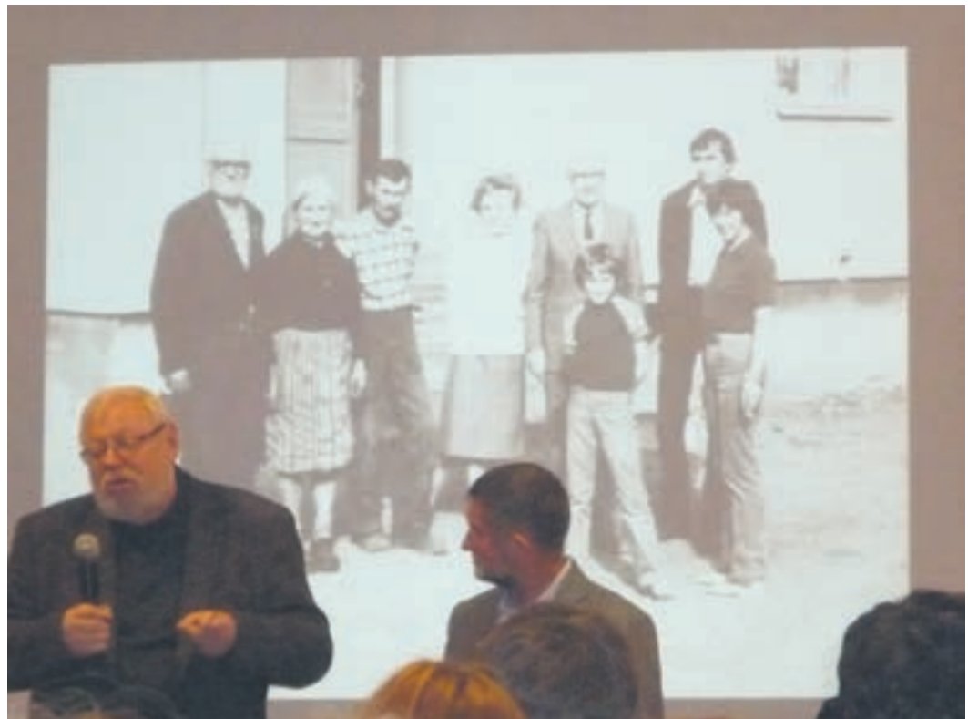
Prezentacja książki „Uciekinier” Instytut Francuski w Warszawie 24.11.2012 r.